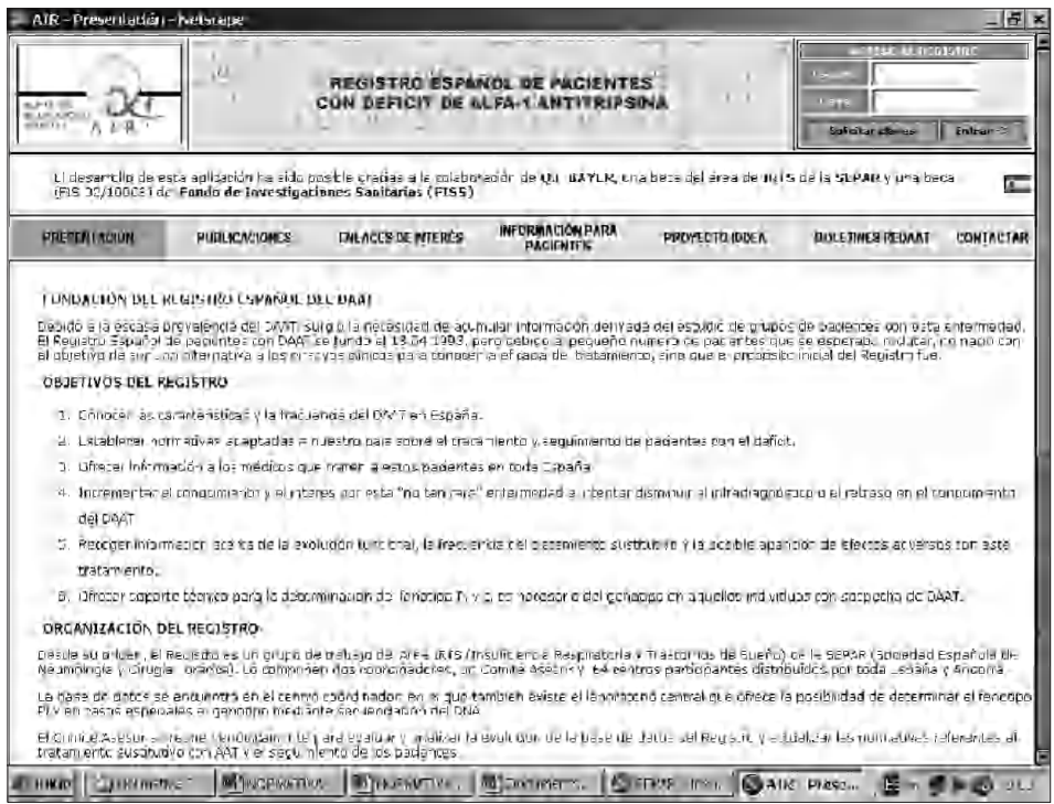
Fig. 3. Página inicial del Registro Español de pacientes con déficit de alfa-1-antitripsina. Disponible en: http://db.separ.es/cgi-bin/wdbegi.exe/separ/air.baseline_pack_3.indice?p_origen=34

a publicaciones. También existen links con otras webs médicas y de asociaciones de enfermos. El registro de pacientes se realizará mediante acceso personal. Para ello solicitaremos claves y en unos días recibiremos “usuario” y “clave” para nuestro acceso personal (tabla IX y fig. 3).